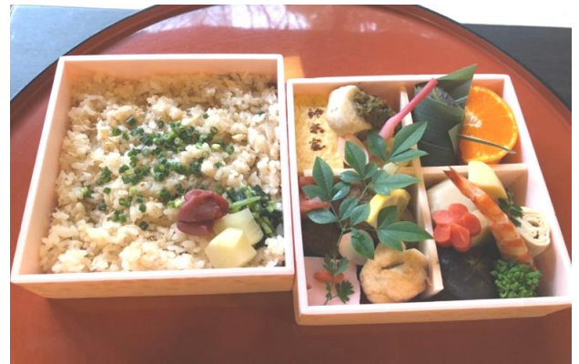
焼魚、煮物、揚物など華やかなお弁当です 酒の肴にも。