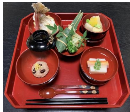
初節句、お七夜、初誕生等にお子様膳(1,600円～)、 お食い初め膳(4,000円)もご用意します。