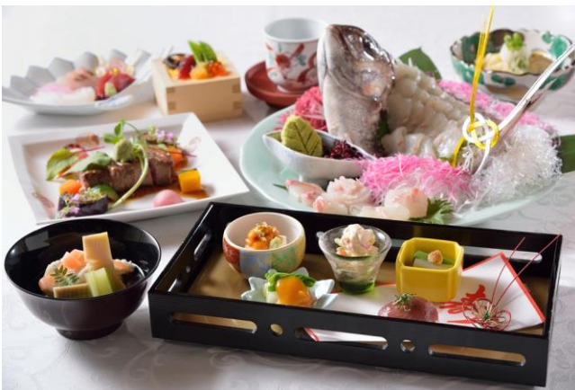
※写真はイメージです。こちらをお弁当にご用意します。