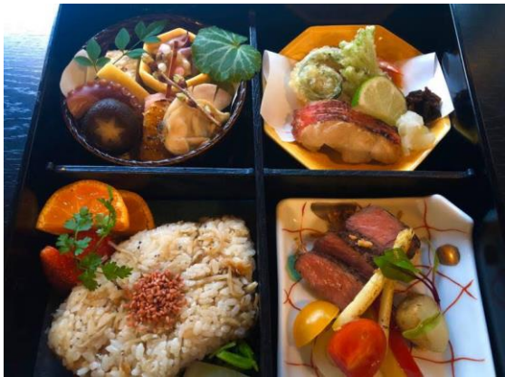
黒毛和牛ステーキ入りの懐石料理に赤だしが付きます